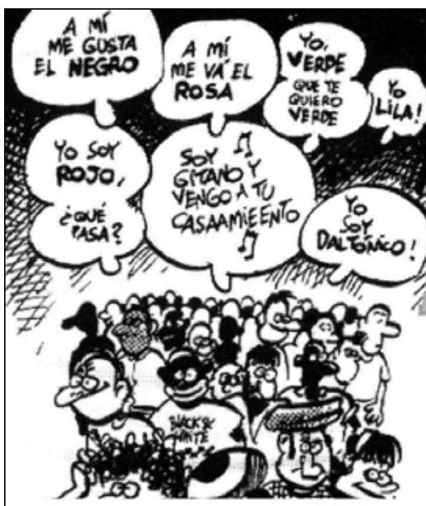
Fundació per la Pau